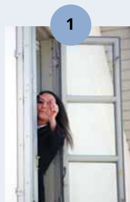
TREKK UT SPLINTEN