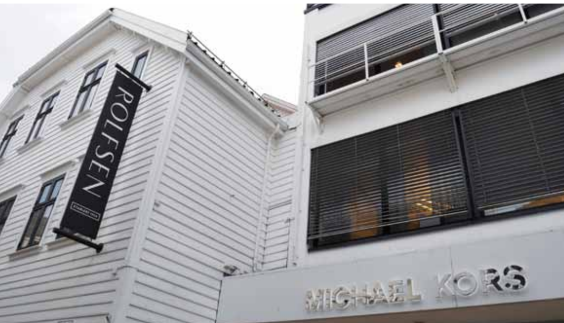
Skreddersydd rømningsbalkong og Modumstige i pulverlakkert hvit.