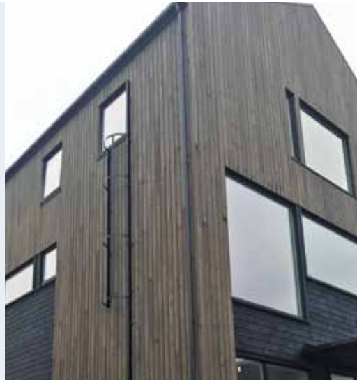
Modum utfellbar ryggvernstige.

Modumstigen fås i alle farger, men lagerføres aluminium, sort og hvitt.