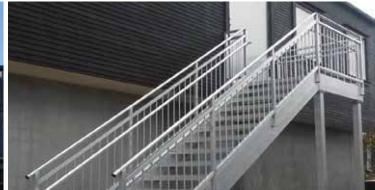
Vi leverer og monterer spesialtilpassede rømningsstrapper.