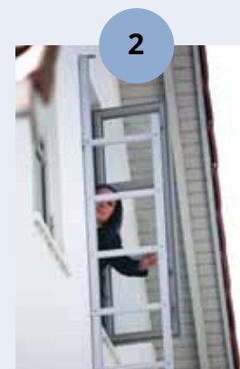
FOLD UT STIGEN