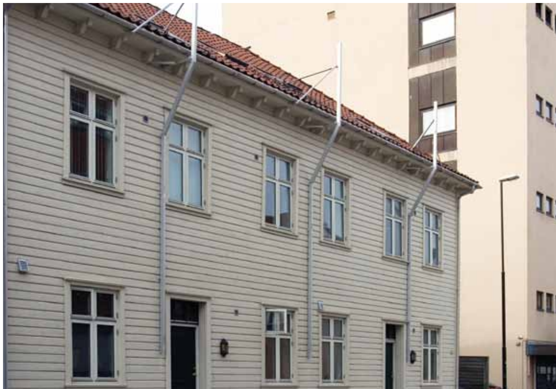
Modum gesimsstiger montert fra takvindu i bygård.