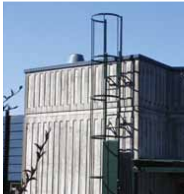
Inspeksjonsstige med ryggvern.